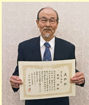
第2部門 (主食用米作付面積10ha未満)