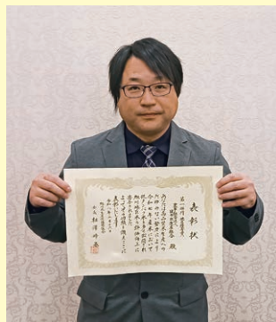
第1部門 (主食用米作付面積10ha以上)

3月16日、旭川トーヨーホテルにて旭川米生産流通協議会主催による令和7年度高品質米生産者表彰式が開催されました。この表彰は、高品質米生産出荷に顕著な成績を収められた生産者に対しその努力を称え、旭川地区の更なる高品質米出荷を目指す取り組みであり、当地区から3名の生産者が表彰されました。受賞された3名の生産者の方、栄えある受賞を心よりお祝い申し上げます。