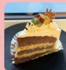
スイーツポテト ショートケーキ

前回のひかりプラス (No.9) で取材にご協力いただいたsweets shop CHIAKIさんに東旭川産さつまいも「シルクスweet」を使用したコラボスイーツを作っていただきました。