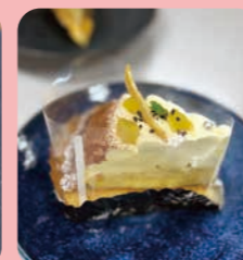
スイーツポテトタルト