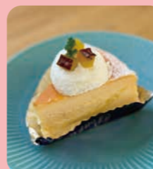
スイーツポテト チーズケーキ