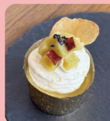
生スイーツポテト