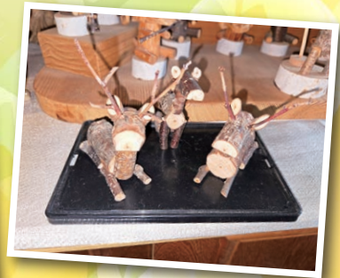
（豊田地区：匿名希望様 作）